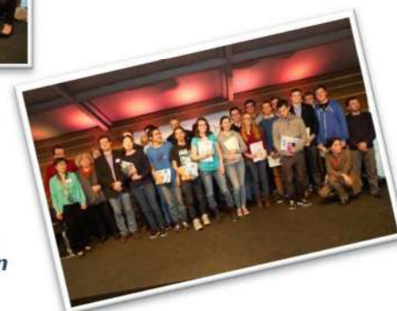
Les lauréats reçoivent leurs prix au nom de l'UIC IDF et de la SCF section Ile-de-France.